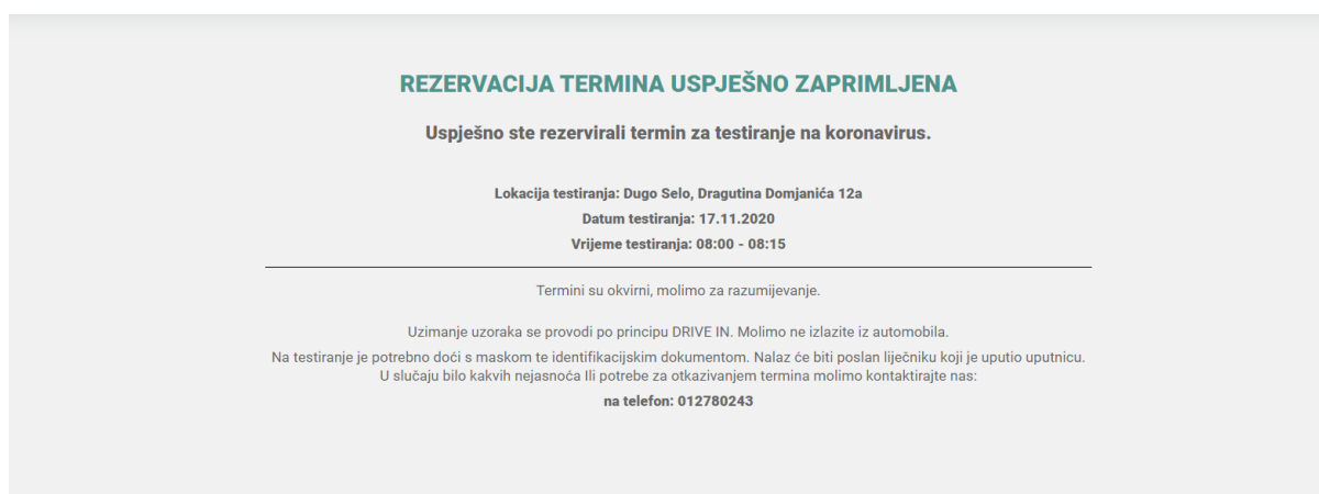
Slika 3: Uspješno spremanje prijave za testiranje

Ukoliko su svi podaci ispravno uneseni i prijava je uspješno spremljena, korisniku se prikazuje gore navedeni ekran potvrde. Na uneseni e-mail sa prethodne forme prijavitelju se šalje potvrdni e-mail u kojem se nalaze odabrani podaci sa forme za unos i link za brisanje novo kreiranog termina za testiranje.